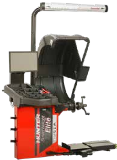
Изображение SWE00E с дополнительным оборудованием